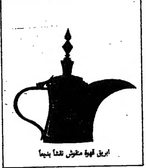
أباريق قهوة مقوش نقشاً بديها